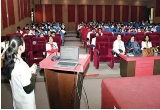
गज केसरी युग

मुरादनगर (मनीष गोयल)। आईटीएस डेंटल कॉलेज में छात्रों को दंत चिकित्सा के क्षेत्र में अनुसंधान के क्षेत्र में नवीन दंत चिकित्सकों को प्रोत्साहित करने के लिए यंग रिसर्चर अवार्ड का आयोजन किया गया। कार्यक्रम का मूल्यांकन करने के लिए इंटरनल